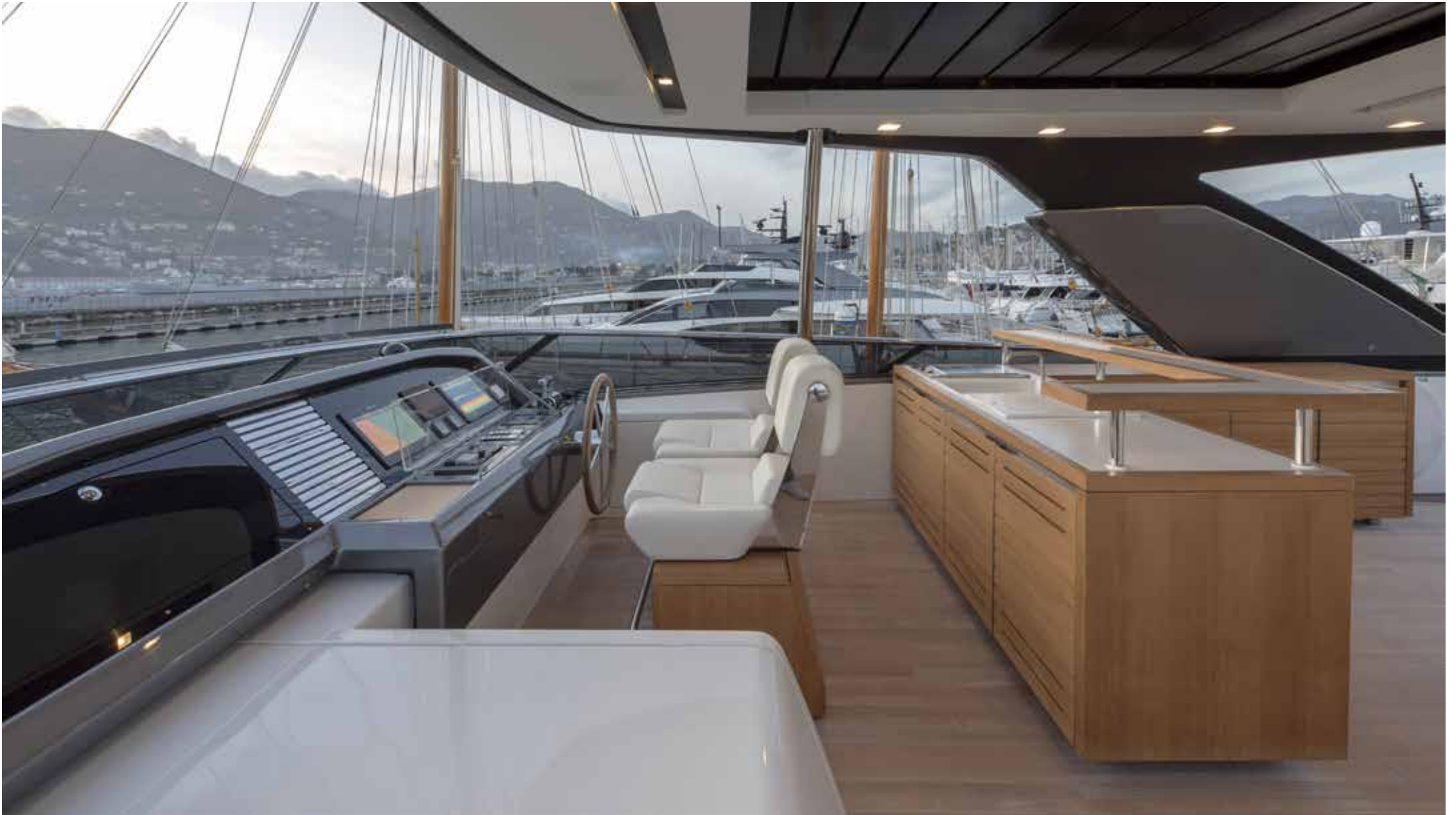
19. Flying bridge