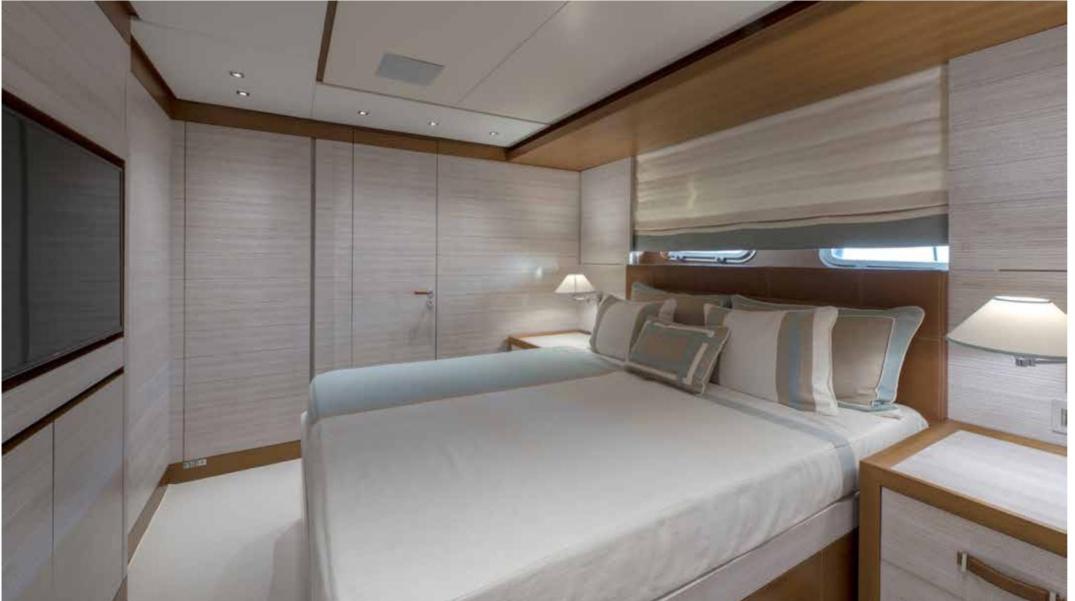
14. Vip cabin