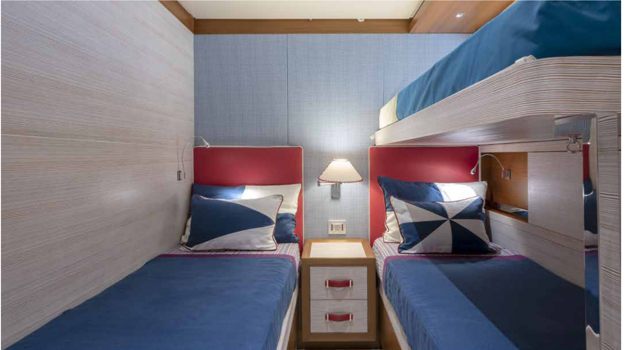
17. Guest cabin