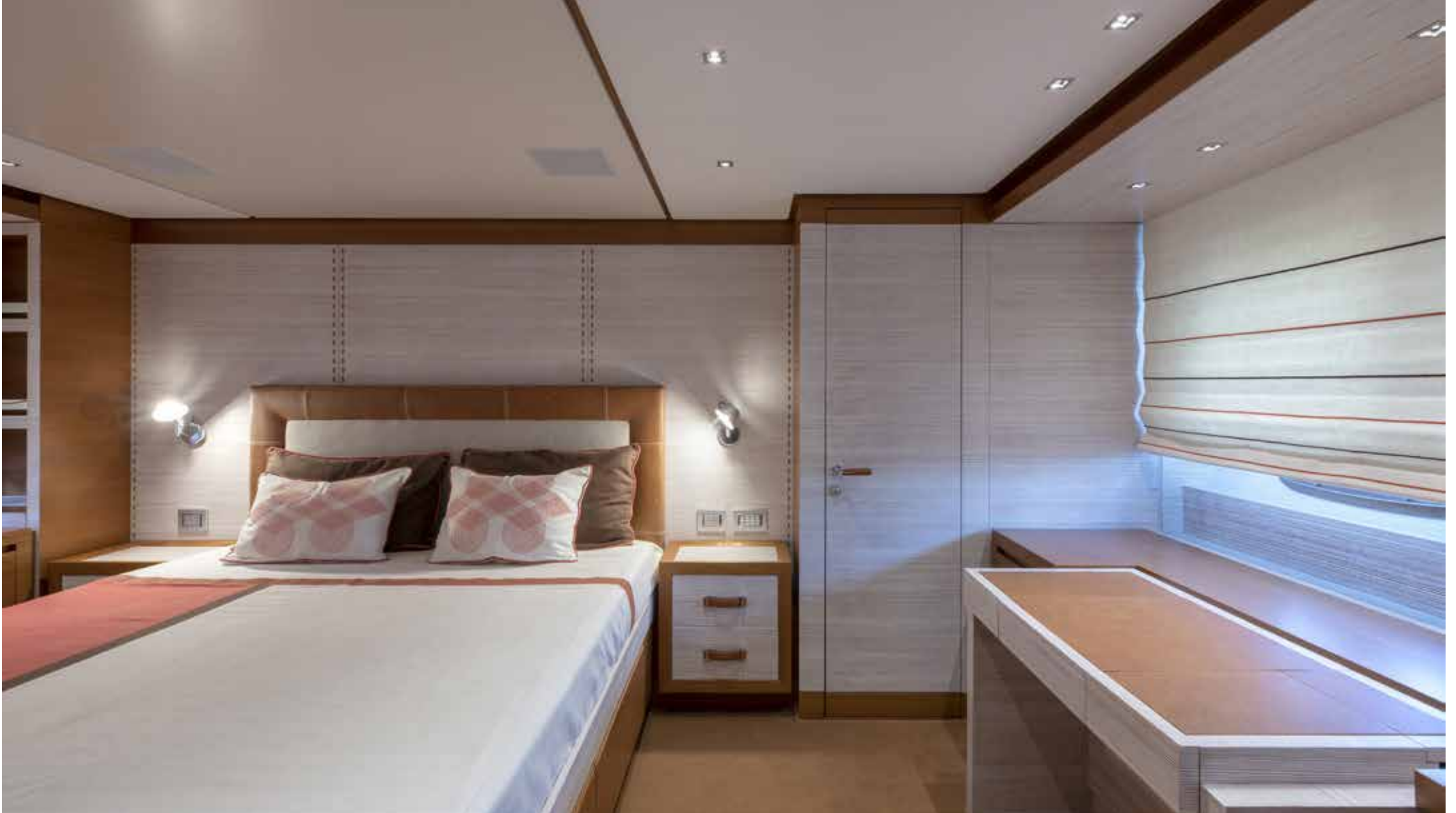
12. Owner's cabin