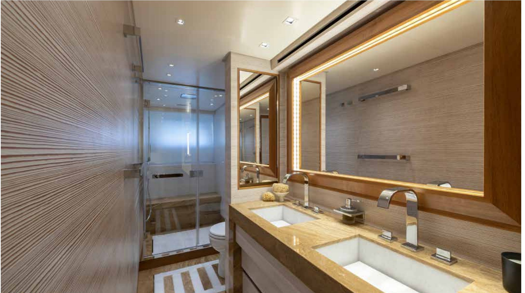
13. Owner's bathroom