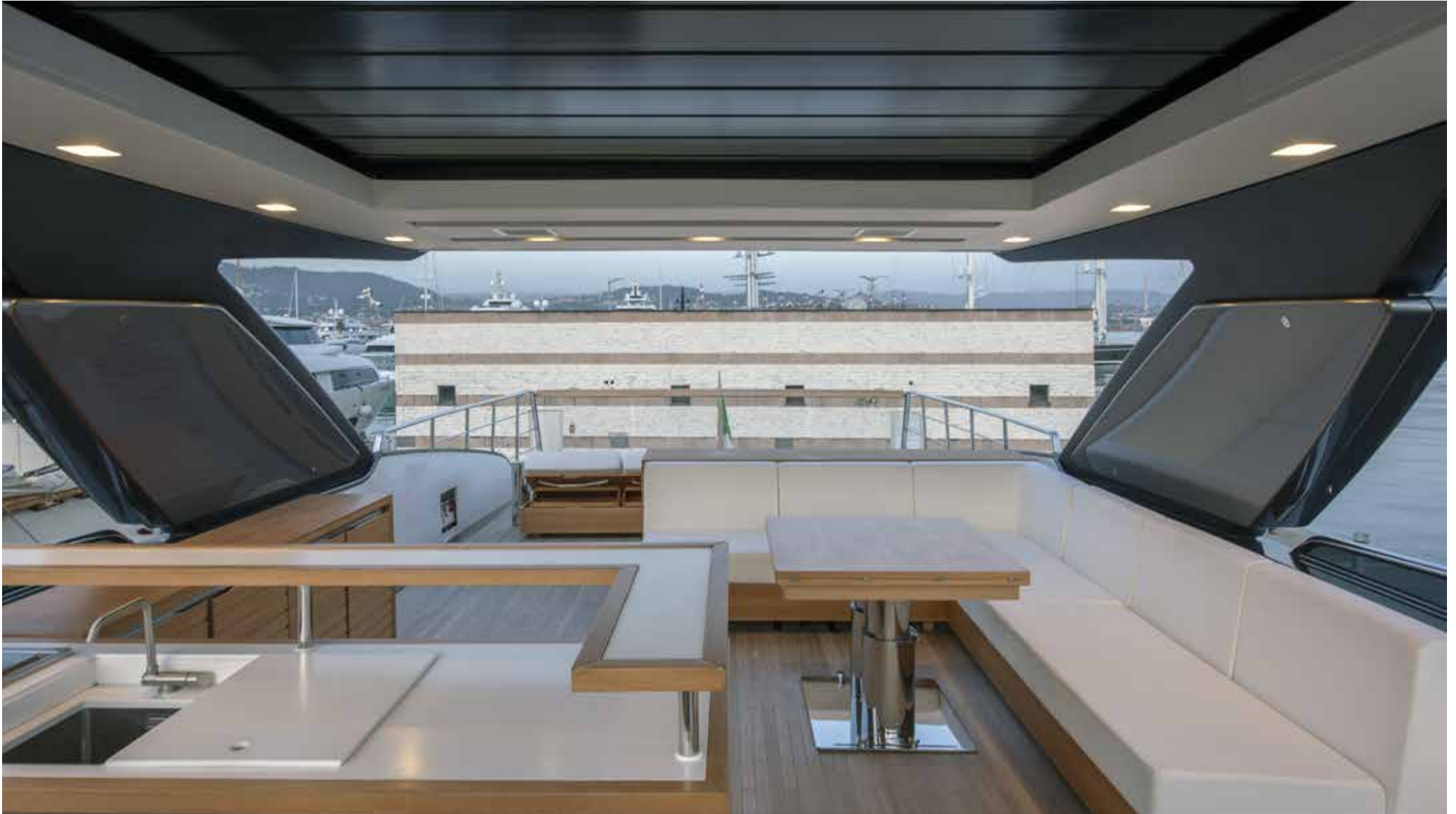
21. Flying bridge