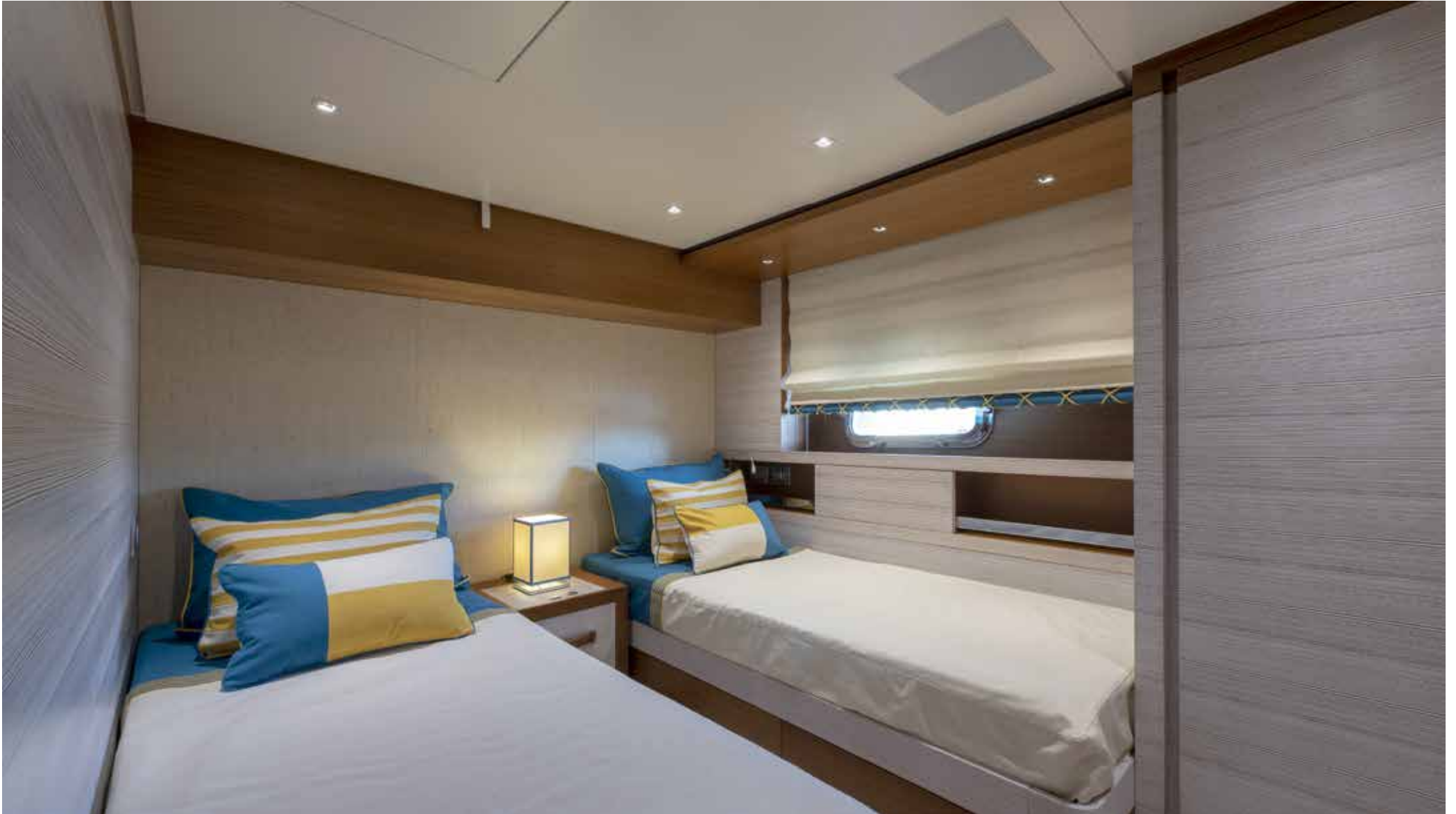
18. Guest cabin