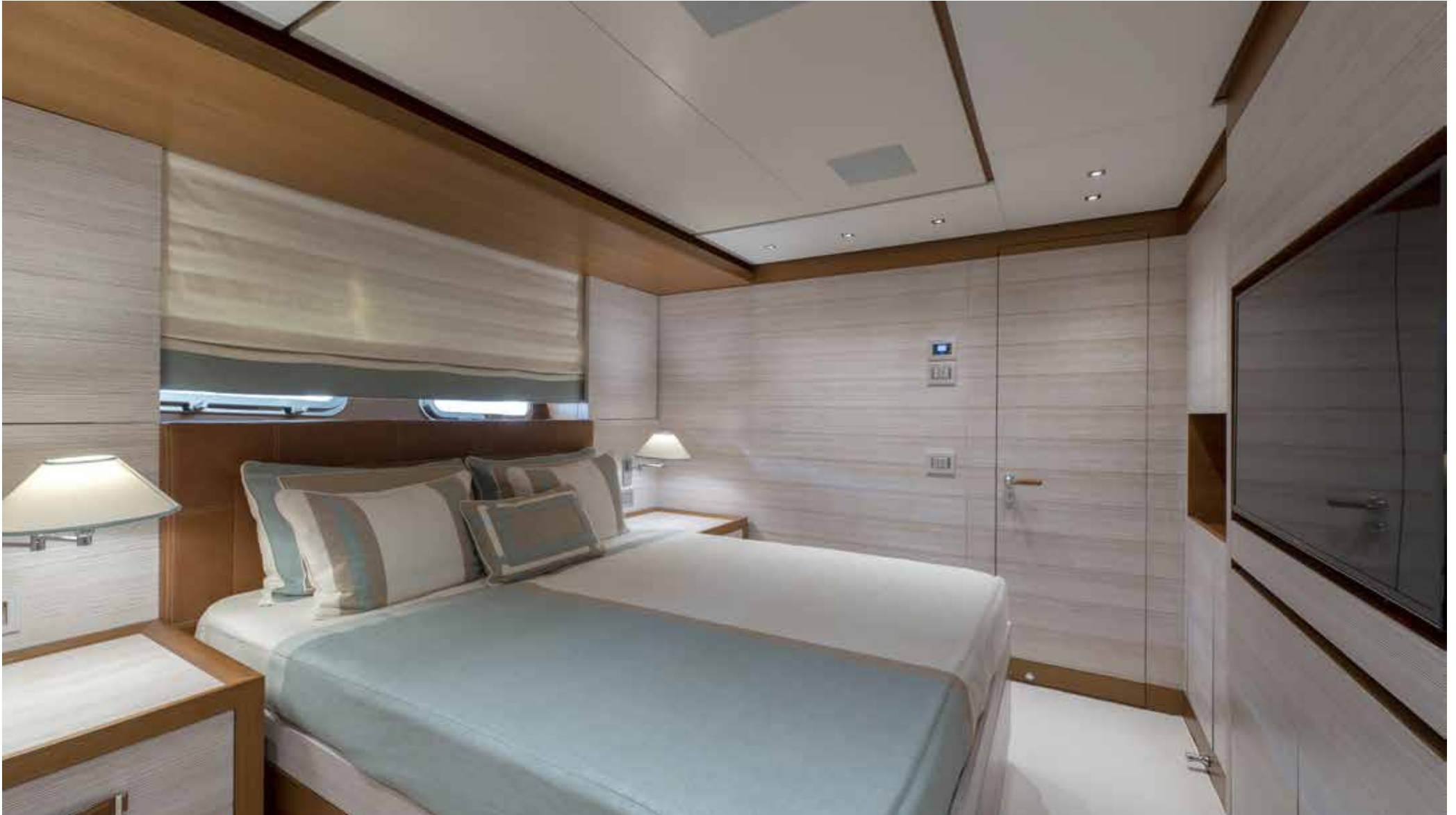
15. Vip cabin