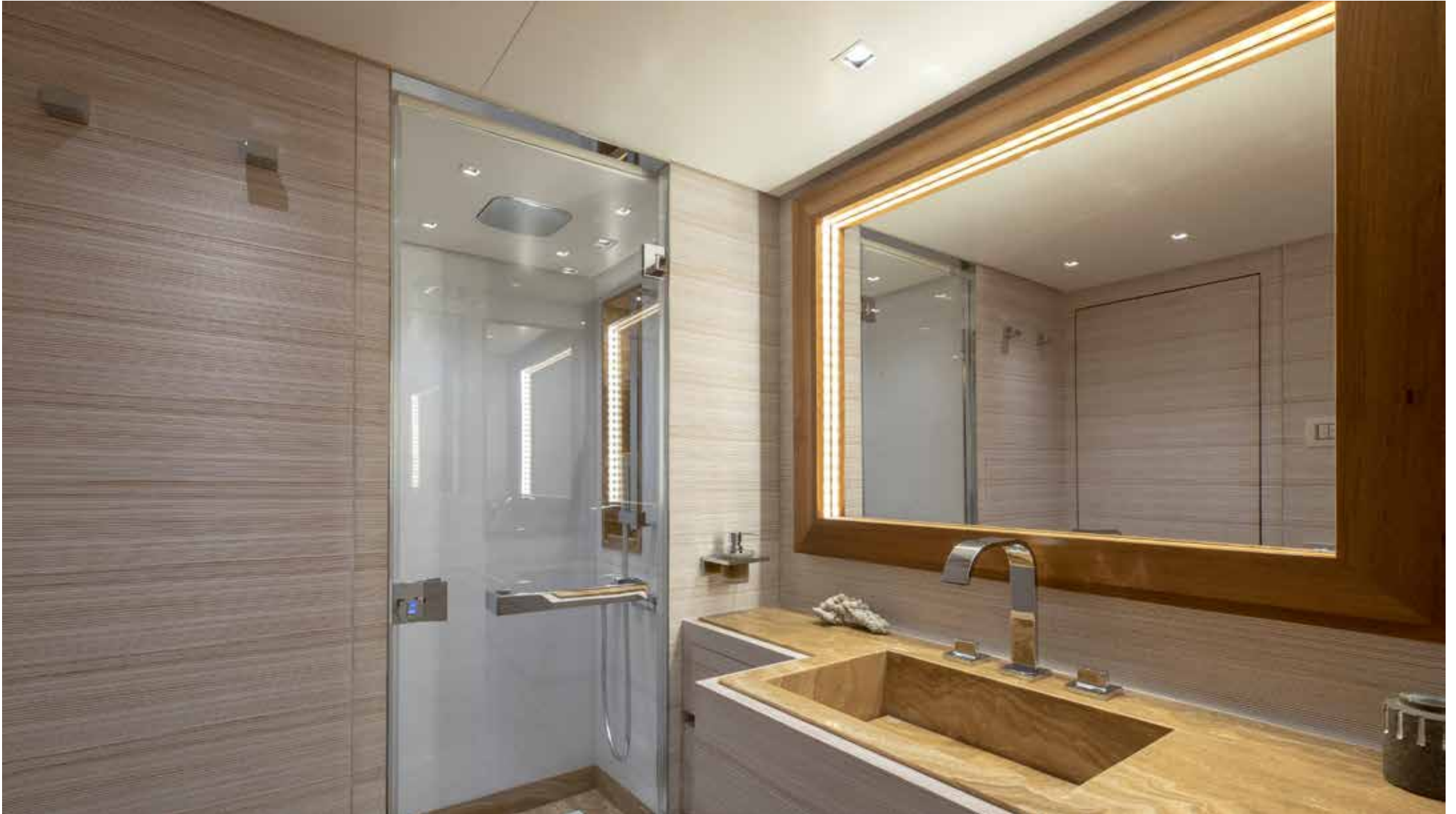
16. Vip bathroom