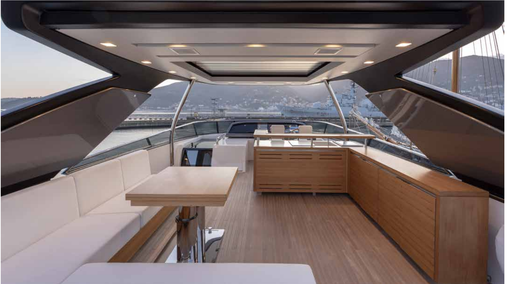
20. Flying bridge