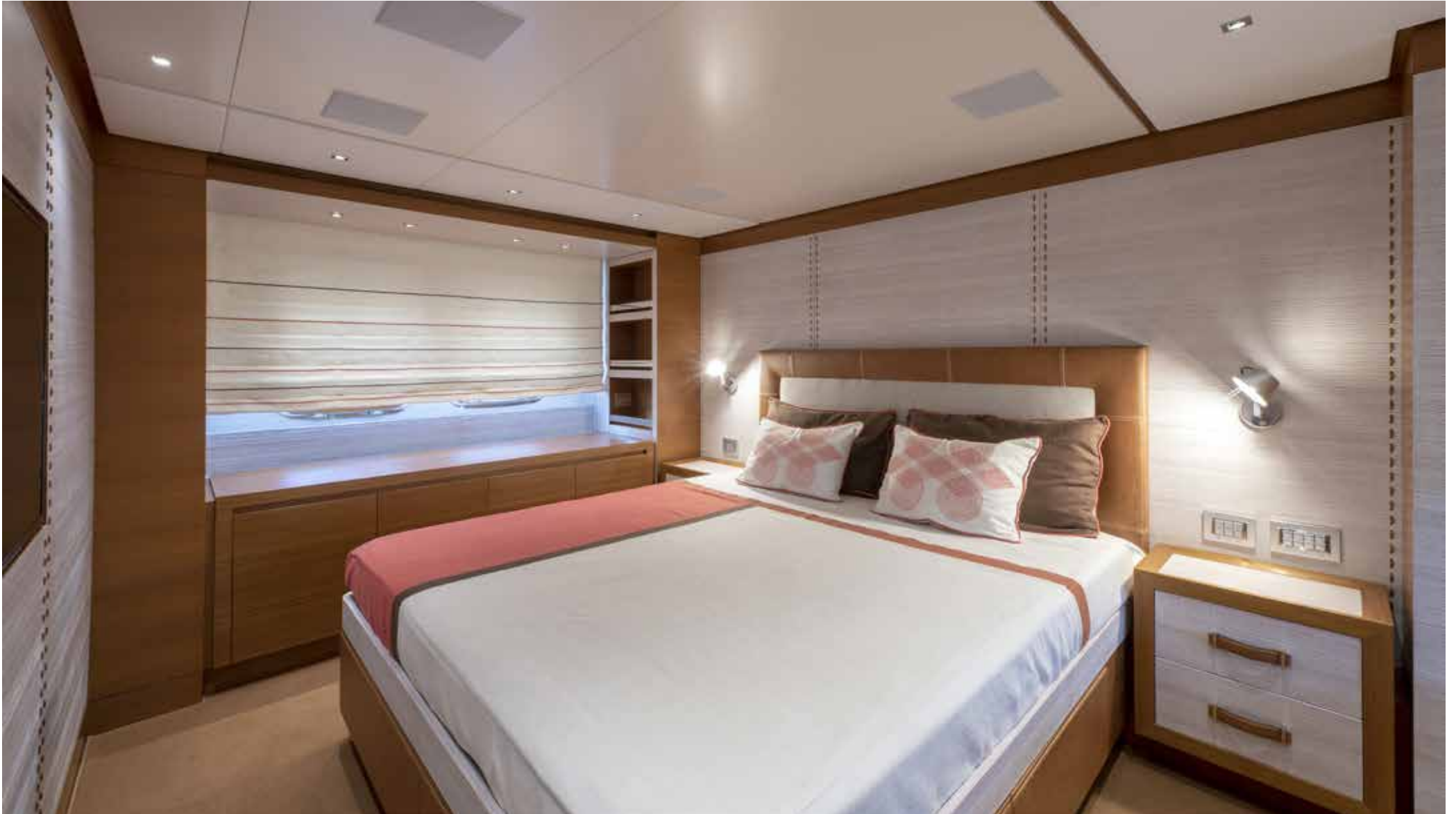
11. Owner's cabin